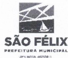
TABELA – IV

ANEXA AO DECRETO Nº. 002/2024, de 05 de JANEIRO de 2024.