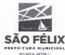
TABELA – III

ANEXA AO DECRETO Nº. 002/2024, de 05 de JANEIRO de 2024.