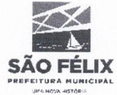
TABELA – VII

ANEXA AO DECRETO Nº. 002/2024, de 05 de JANEIRO de 2024.