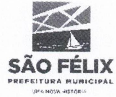
TABELA – VI

ANEXA AO DECRETO Nº.002/2024, de 05 de JANEIRO de 2024.