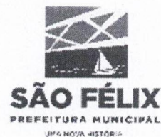
TABELA – II

ANEXA AO DECRETO Nº. 002/2024, de 05 de JANEIRO de 2024.