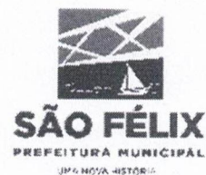
TABELA – V

ANEXA AO DECRETO Nº 002/2024, de 05 de JANEIRO 2024.